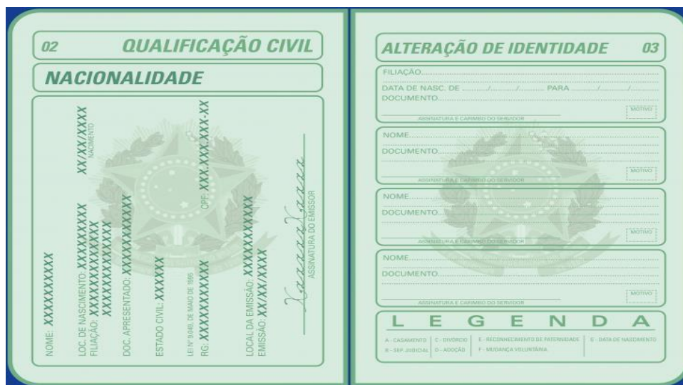
(Imagem meramente ilustrativa)

2) Cópia da página de Qualificação Civil: página subsequente a página de identificação, na qual constam os dados pessoais do titular da CTPS: