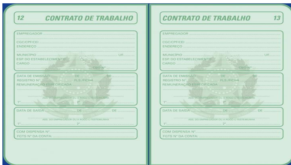
(Imagem meramente ilustrativa)