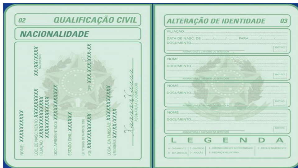
(Imagem meramente ilustrativa)

2) Cópia da página de Qualificação Civil: página subsequente a página de identificação, na qual constam os dados pessoais do titular da CTPS: