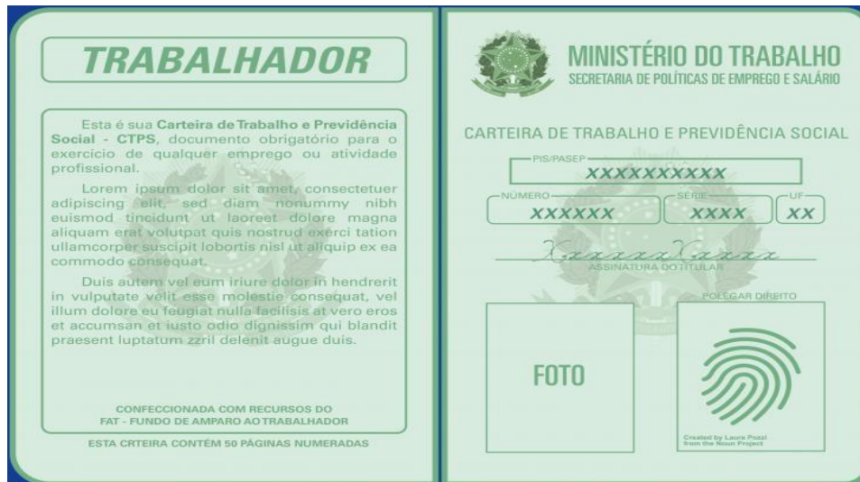
(Imagem meramente ilustrativa)

1) Cópia da página de identificação da CTPS: página na qual consta a foto do titular da Carteira de Trabalho: