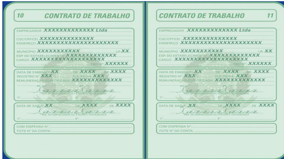
(Imagem meramente ilustrativa)

Observe o exemplo abaixo. Neste caso, o estudante enviaria as cópias das páginas 11 e 12: