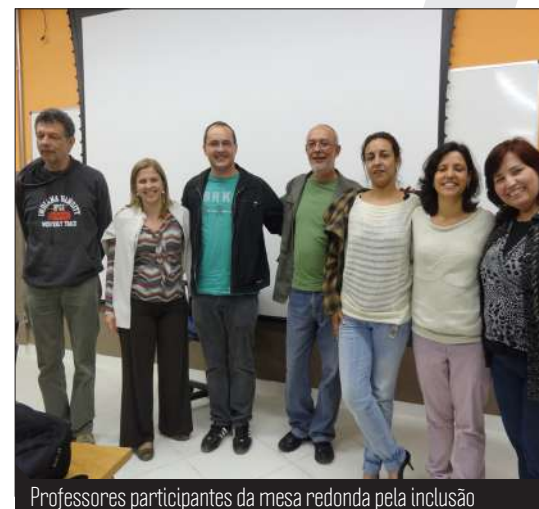
Professores participantes da mesa redonda pela inclusão