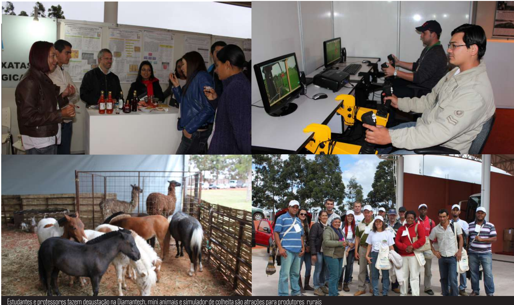
Estudantes e professores fazem degustação na Diamantech, mini animais e simulador de colheita são atrações para produtores rurais

Realizada pela Faculdade de Ciências Agrárias (FCA) da UFMG, a Semana do Produtor Rural da UFMG - DIAMANTAGRO comemora o sucesso de público no evento com um total de 450 produtores rurais inscritos, além dos visitantes. Em sua primeira edição, a DIAMANTAGRO teve como tema central a "Tecnologia para o homem do campo" e foi direcionada aos produtores rurais do Vale do Jequitinhonha, com o objetivo de divulgar e incentivar o uso de técnicas e tecnologias que contribuam para o aumento da produtividade agropecuária, para a melhoria da gestão das atividades rurais, aumento da conservação ambiental e melhoria da qualidade de vida do homem do campo.