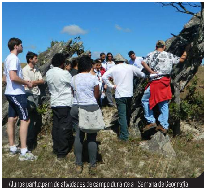
Alunos participam de atividades de campo durante a I Semana de Geografia

O evento teve o apoio da Faculdade Interdisciplinar em Humanidades (FIH) e das Pró-Reitorias de Graduação (Prograd), Pesquisa e Pós-Graduação (PRPPG), Diretoria de Comunicação Social (Dicom) e Reitoria da UFVJM.