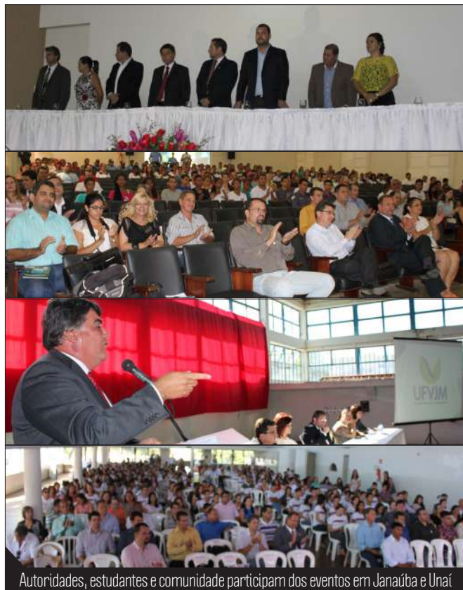
Autoridades, estudantes e comunidade participam dos eventos em Janaúba e Unaí