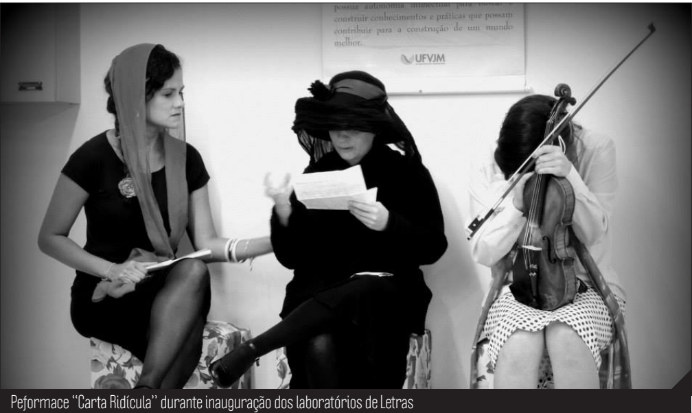
Peformace “Carta Ridícula” durante inauguração dos laboratórios de Letras

Além disso, dois bolsistas-atividade estão disponíveis no laboratório e são responsáveis pelo agendamento eletrônico dos espaços e dos equipamentos. A inauguração contou com a presença dos integrantes do Projeto de Extensão “Encontros