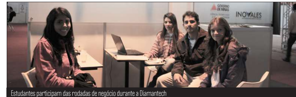
Estudantes participam das rodadas de negócio durante a Diamantech