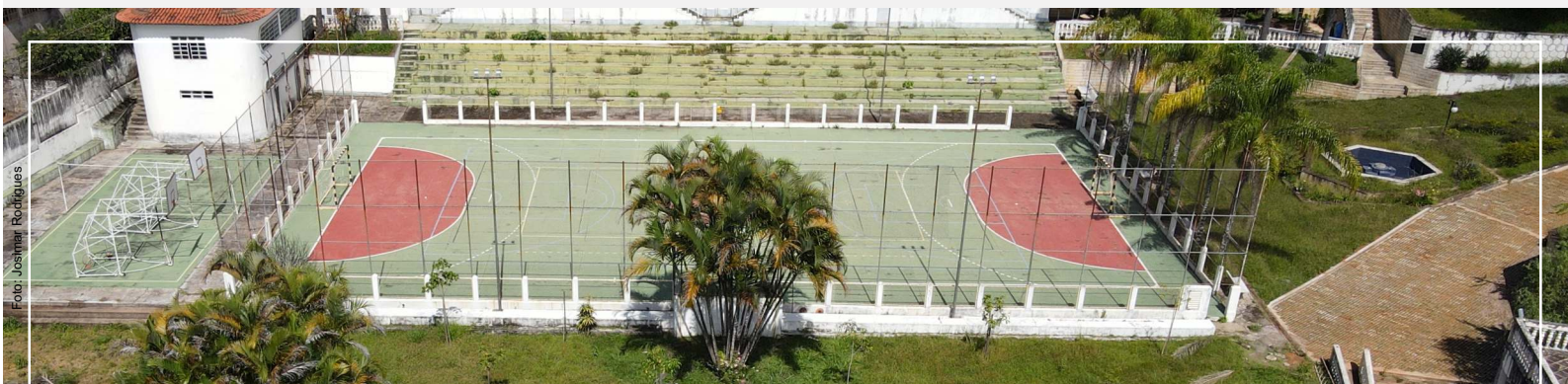
Vista do Campus I - Diamantina