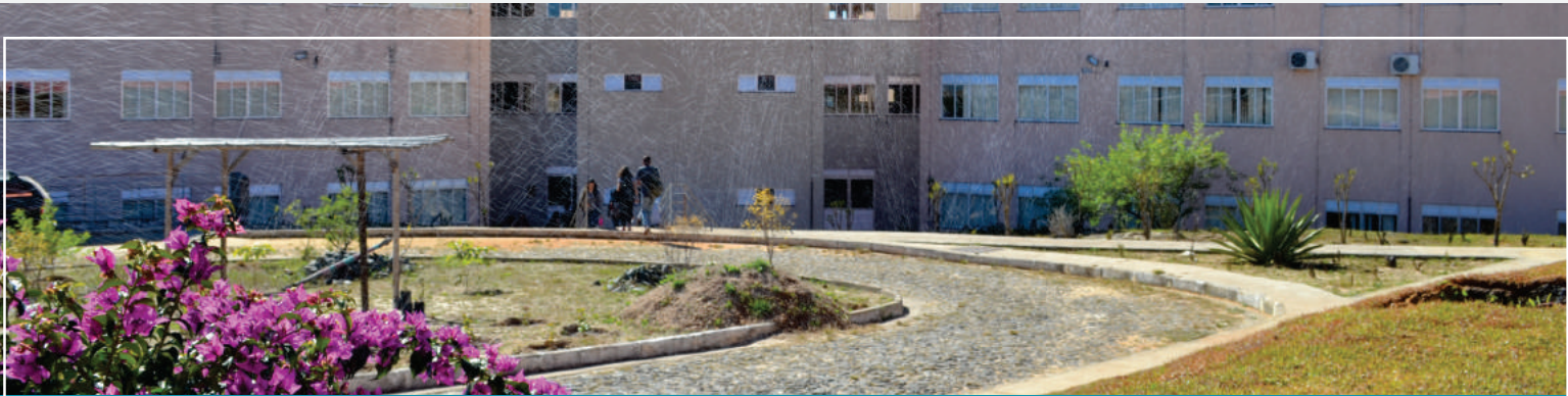
Prédio do DCB e DCBio - Campus JK - Diamantina