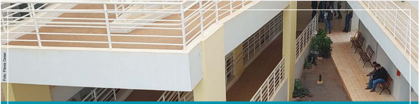
Pavilhão de Aulas - Campus Unaí