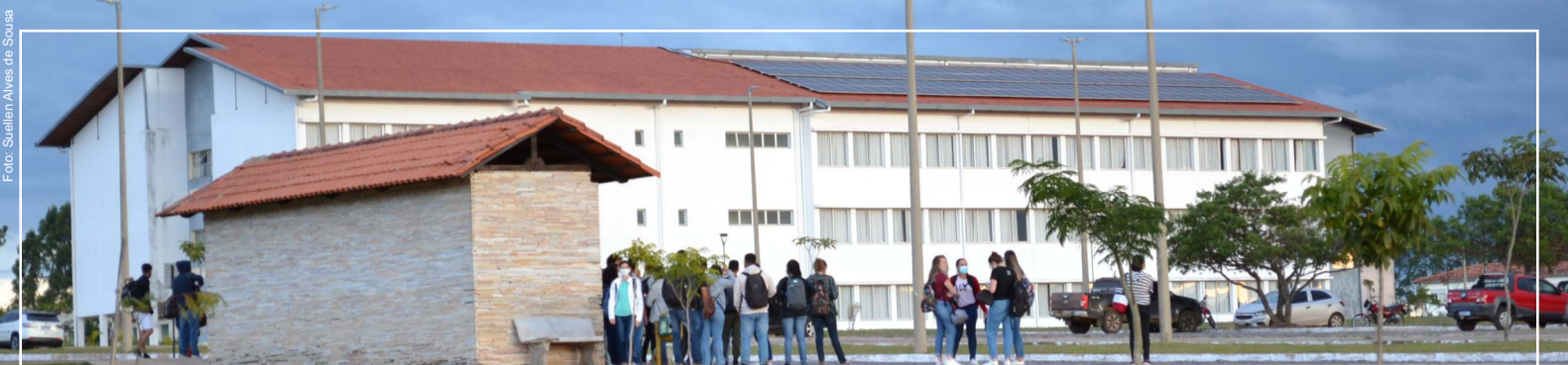
Vista do Campus JK - Diamantina