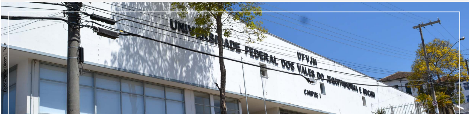
Vista do Campus I - Diamantina