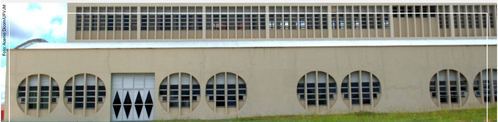
Prédio do curso de Educação Física - Diamantina