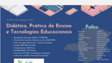
Crédito: Ricardo Baral