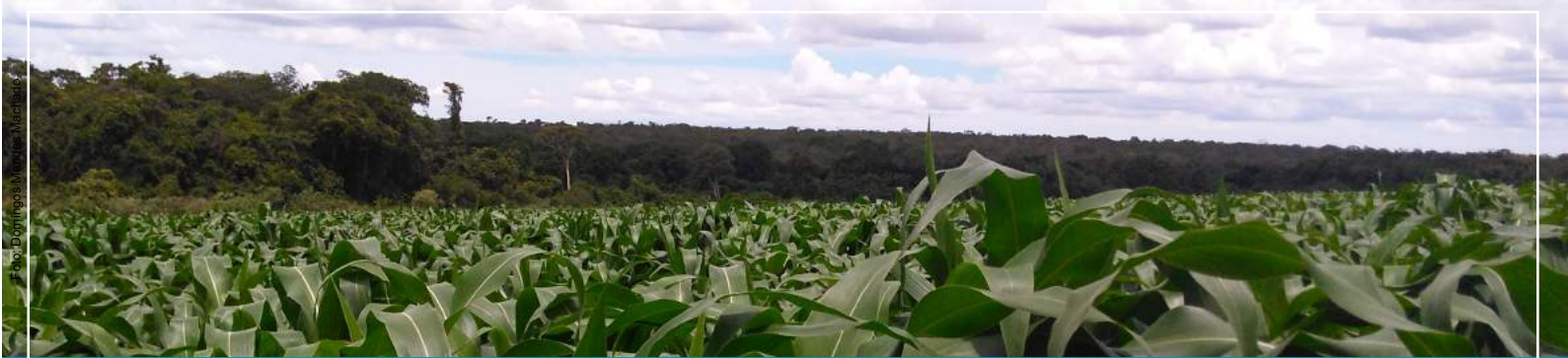
Vista da Fazenda do Moura - Curvelo