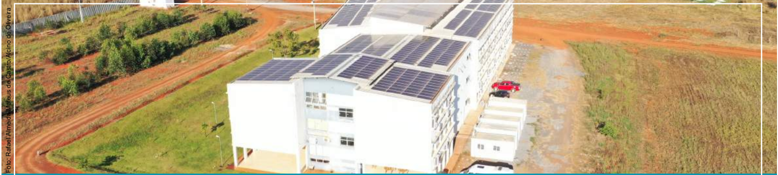
Vista do Campus Unai - Unai