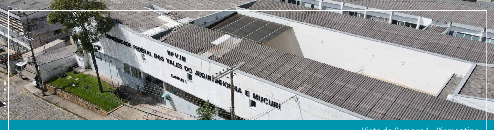
Vista do Campus I - Diamantina