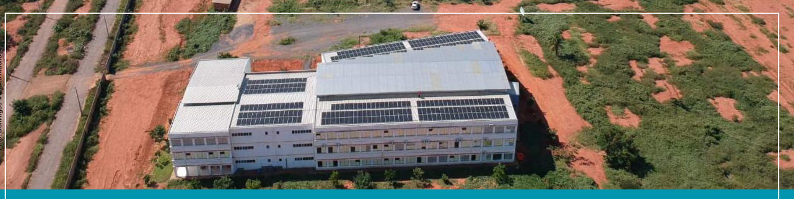
Vista do Campus Janaúba - Janaúba