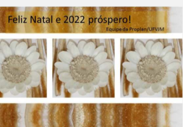
Crédito: Flávia Dornelas Venti