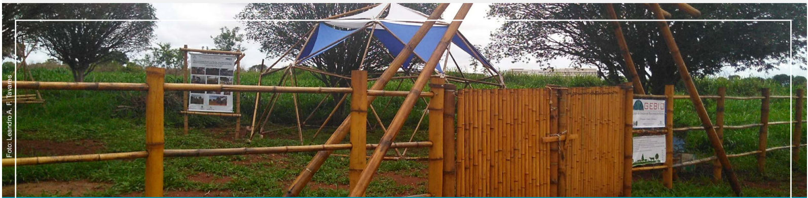
Fazenda Experimental Santa Paula - Campus Unaí